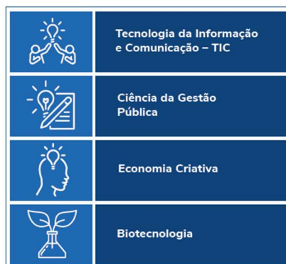
Imagem, página 16 | Nível de maturidade do ecossistema

Teremos como propósito o estabelecimento de um ambiente de inovação - incubadora, com o apoio da FAPDF de forma que se possa ter uma metodologia de viabilização de tecnologias inovadoras para soluções prioritárias definidas a partir do foco de atuação dos setores abaixo listados: